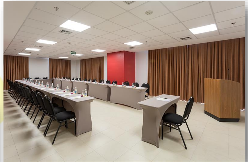
Sala São Vicente